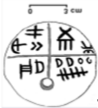
Tatárlakai agyagtábla, i.e. 5 500