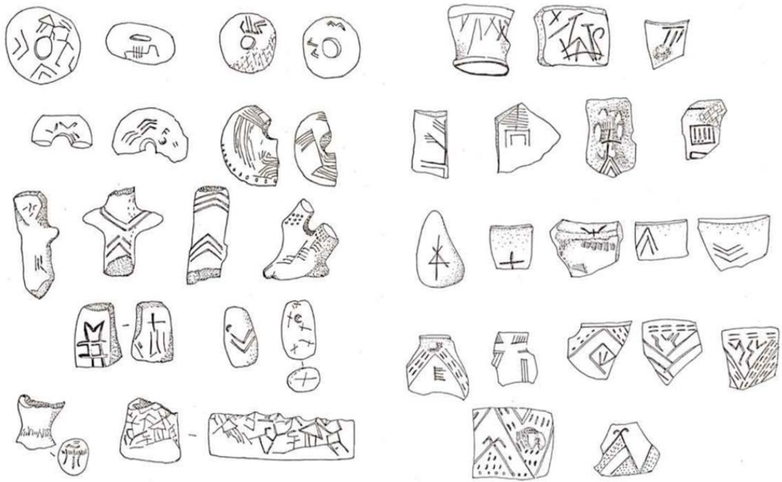
Tordosi leletek Torma Zsófia Jegyzetfűzetéből: