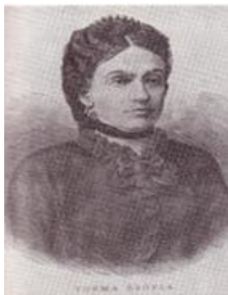
Dr. Torma Zsófia 1882-ben

Fontos feladatunk az általa nagy gonddal bővítetett és fontosnak