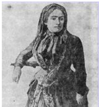
Dr. Torma Zsófia 1870-ben

Dr. Zsófia Torma was born on September 26th, 1832 in Csicsókeresztúr (today Rumania's Cristești Ciceului) and she died on November 14th, 1899 in Szászváros (today Rumania's Orăștie). At Zsófia's time, Transylvania was a part of Hungary. Her research was connected to the Hungarian academic world, culture, history and tradition. She was the child of landowners of a large estate and she may thank them for her dedication to archeology and excavation, and also her love for science.